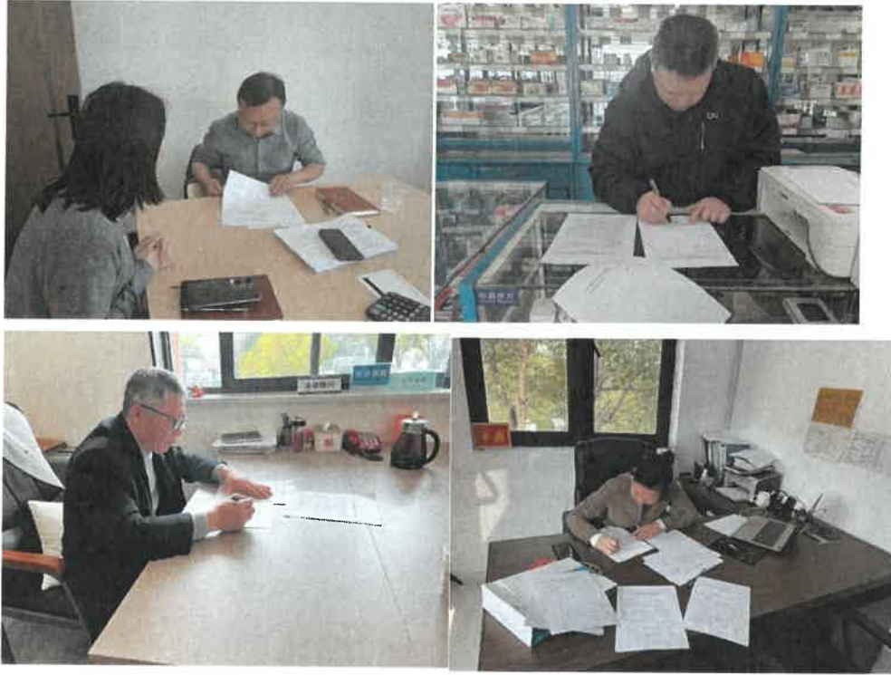
实地走访照片资料